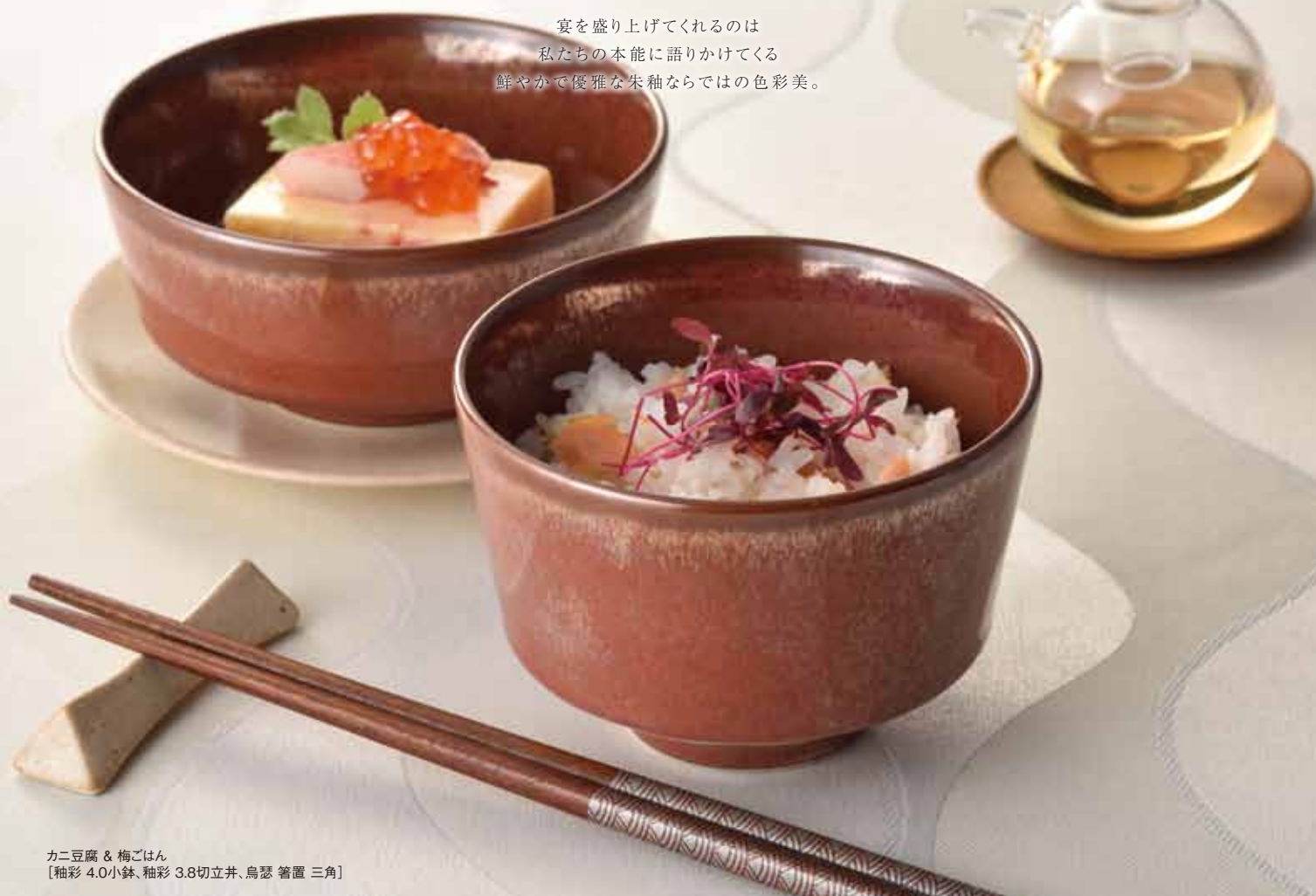
カニ豆腐 & 梅ごはん [釉彩 4.0小鉢、釉彩 3.8切立井、烏瑟 箸置 三角]

宴を盛り上げてくれるのは 私たちの本能に語りかけてくる 鮮やかで優雅な朱釉ならではの色彩美。