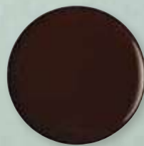
NEW 18200070 5.5刺身皿 ¥1,350 D17.3×H1.8