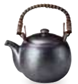
NEW 75100098 3合土瓶 ¥3,500 L13.6×H10.5×H10.2・480cc 00000021 土瓶茶こし ¥500 D6.7×H5.9 00000020 土瓶つる ¥500 L9×S1.1×H10