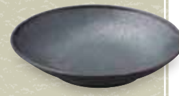
NEW 75100043 9.0盛鉢 ¥3,800 D28.2×H5.5