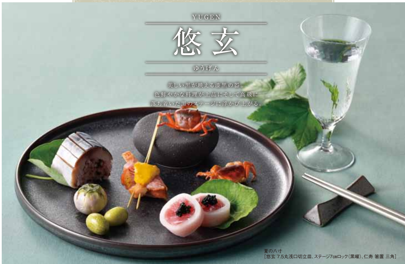
夏の八寸 [悠玄 7.5丸浅口切立皿、ステージ7cmロック(黒曜)、仁寿 箸置 三角]

美しい黒が映える漆黒の器。 色鮮やかな料理が上品にそして高級に 落ち着いた黒のステージに浮かび上がる。