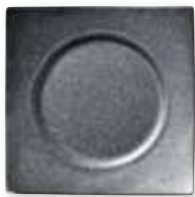
NEW 75100477 23cmハンププレート ¥3,800 D23×H3.8 ID15.2