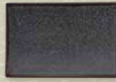
NEW 75100661 21cm焼物皿 ¥1,700 L21×S14×H2