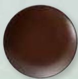
NEW 18200002 4.0皿 ¥680 D12.6×H1.6