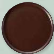
NEW 18200838 6.0丸浅口切立皿 ¥1,450 D19×H1.6