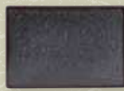
NEW 75100656 16cm串皿 ¥1,200 L16×S11×H1.6