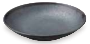
NEW 75100050 尺.0盛鉢 ¥6,300 D30.1×H5.7