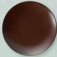
NEW 18200006 6.0皿 ¥1,150 D18.8×H2.1