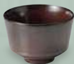
NEW 18200248 3.8切立井 ¥1,150 D11×H7.5・410cc