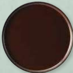
NEW 18200845 7.5丸浅口切立皿 ¥2,800 D22.9×H1.7