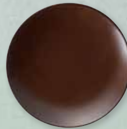
NEW 18200010 8.0皿 ¥2,600 D24.8×H2.2