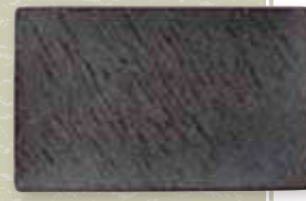
NEW 75195423 絶佳(ぜっか)9.5長角皿 ¥4,500 L28.9×S18×H1.5