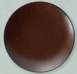
NEW 18200012 9.0皿 ¥3,000 D27.8×H2.2