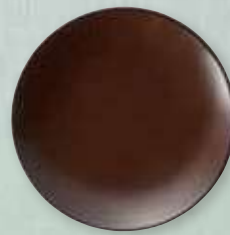
NEW 18200008 7.0皿 ¥1,300 D21.3×H2.2