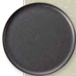
NEW 75100845 7.5丸浅口切立皿 ¥2,800 D22.9×H1.7