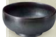
NEW 75100261 6.0深井 ¥2,900 D18.2×H8.3