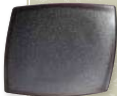
NEW 75100375 21cm菱形皿 ¥2,300 L20.6×S18.1×H4.1