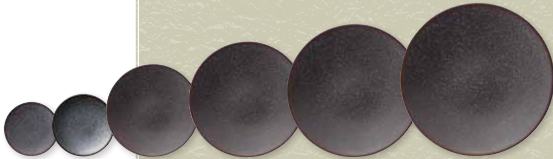
NEW 75100002 4.0皿 ¥680 D12.6×H1.6 NEW 75100004 5.0皿 ¥830 D15.3×H1.8 NEW 75100006 6.0皿 ¥1,150 D18.8×H2.1 NEW 75100008 7.0皿 ¥1,300 D21.3×H2.2 NEW 75100010 8.0皿 ¥2,600 D24.8×H2.2 NEW 75100012 9.0皿 ¥3,000 D27.8×H2.2