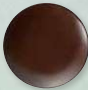
NEW 18200004 5.0皿 ¥830 D15.3×H1.9