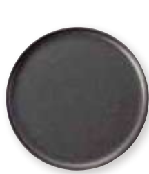
NEW 75100838 6.0丸浅口切立皿 ¥1,450 D19×H1.6